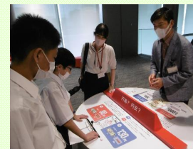
お金について学ぶ