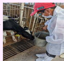
子牛とのふれあい体験

・協力企業等：東京ガスネットワーク、かずさDNA研究所など 計19企業・研究機関、25講座